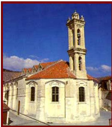
Ιερά Μονή Τιμίου και Ζωοποιού Σταυρού Ομόδους