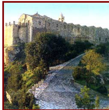
Ιερά Μονή Σταυροβουνίου

✠ Η εικόνα (1) –προηγούμενη σελίδα – είναι ο Μεγάλος Σταυρός από την ιερά μονή Τιμίου και Ζωοποιού Σταυρού Ομόδους